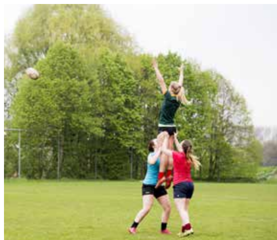
Op de nieuwe site langs de Uilemolenweg zal onder meer een rugbyveld komen.