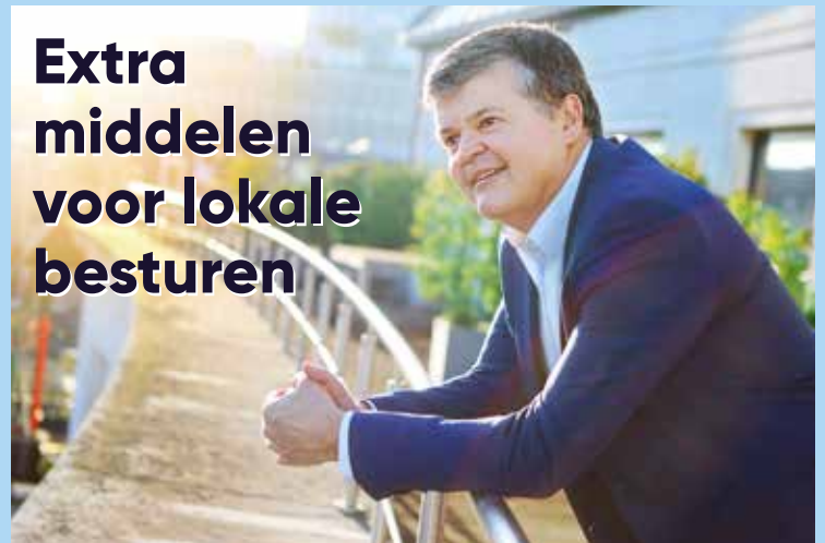
Bart Somers, Vlaams Viceminister-president en minister van Samenleven en Binnenlands Bestuur

Bart Somers: “In Mechelen heb ik de belangrijkste ontdekking uit mijn politieke carrière gedaan: samenleven, dat gebeurt niet in de Wetstraat, maar daar waar mensen elkaar ontmoeten. In onze straten en wijken hebben wij de afgelopen jaren met z’n allen het Mechelen opgebouwd waar wij zo fier op zijn. Een stad waarin elke inwoner zich Mechelaar voelt. Met die les ben ik naar de wetstraat getrokken en dus hoeft mijn eerste beslissing niet te verbazen: we geven de lokale besturen extra middelen.