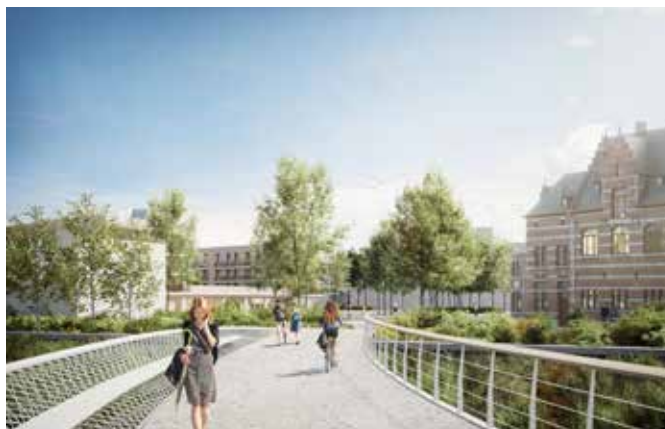
De fiets- en wandelbruggen aan de Keerdoks site

De Stad Mechelen ontvangt 2,15 miljoen euro projectsubsidie van de Vlaamse regering voor de aanleg van fiets- en wandelbruggen die de Keerdoks site moet verbinden met de stad: één over de afleidingsdijle en één naar de Winketkaai. De Keerdoks site wordt nu nog door de vesten afgesloten van het centrum. Ook het kruispunt van de Guido Gezellelaan ter hoogte van de Nonnenstraat zal erdoor veiliger worden. Waar het kan helpt Bart Somers als minister mee aan de verdere stadsvernieuwing van Mechelen.